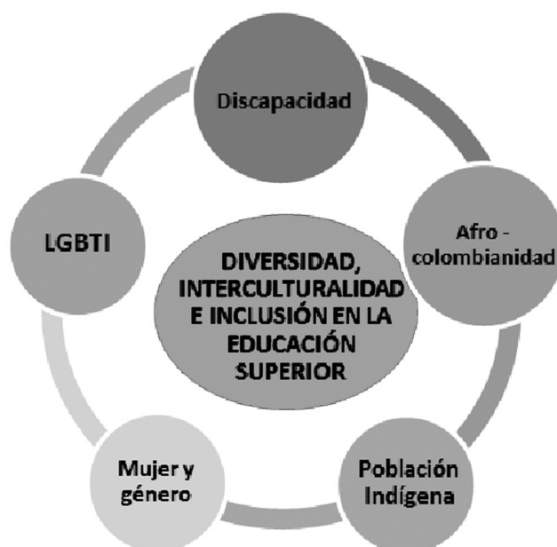
Gráfica 2. Poblaciones en las que enfatiza el Diplomado: Diversidad, Interculturalidad e Inclusión en la Educación Superior.

las comunidades que históricamente han sido objetivo de exclusiones. Así, la propuesta, enfatiza en colectivos indígenas, afrocolombianos, personas con discapacidad, mujer desde la perspectiva de género y sector LGTBI.